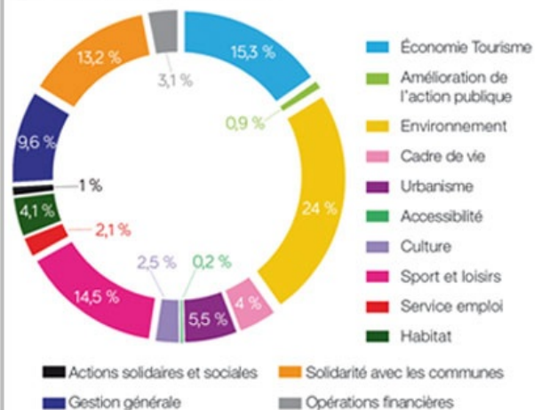
Dépenses réelles : 25 332 k€*